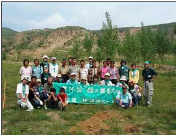
第 14 回 豊寧・緑の親善大使に 参加のみなさん

共に汗を流し、食卓を囲み、楽しい時間を過ごせば・・・あら不思議! 国も老若男女もこえて、心が一つに。